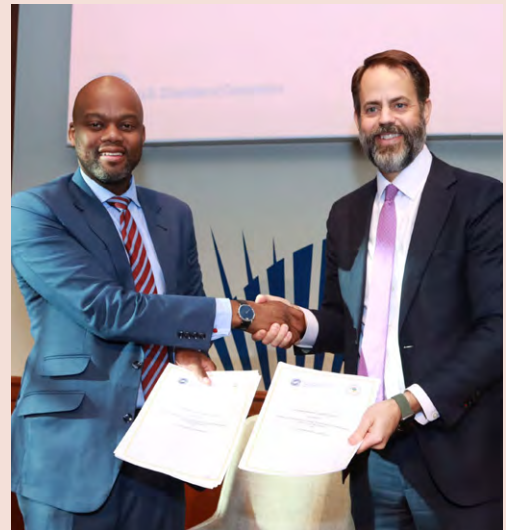
Washington, DC. États-Unis. 13 décembre 2022. Sommet des dirigeants États-Unis - Afrique. Signature d'un protocole d'accord avec le Centre d'affaires États-Unis-Afrique de la Chambre de commerce des États-Unis pour promouvoir le commerce et créer de meilleurs environnements commerciaux en Afrique et aux États-Unis.