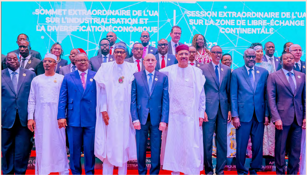
Niamey, Niger. 25 Novembre 2022. 17e Sommet extraordinaire de l'UA et Session extraordinaire de l'Union Africaine sur la Zone de libre échange continentale africaine.