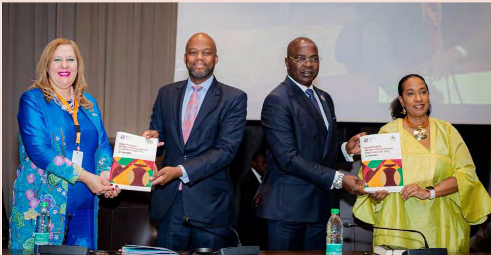
Niamey, Niger. 25 novembre 2022. Zlecaf. Lancement des rapports de cartographie du secteur privé en marge du Sommet extraordinaire de l'UA sur l'industrialisation et la diversification économique.

Lire plus sur tous ces sujets et découvrez plus d'informations sur notre site web www.zlecaf.news